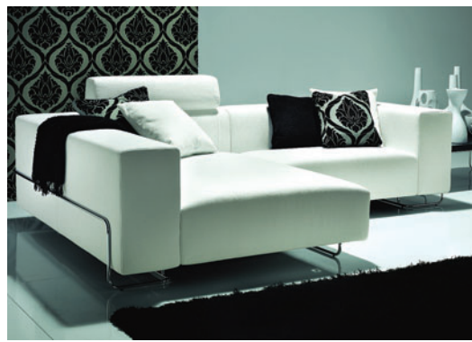
Uno dei tanti modelli di divani offerti al mercato Usa

mobile importante magari firmato da nome altisonante. La fascia più alta si affida in toto al progettista, all'architetto, raramente al designer, per costruire una abitazione importante, dove la decorazione gioca un grande ruolo. Così la presenza in America delle firme italiane di design contemporaneo, certamente di qualità, è abbastanza modesta, incuriosisce ma non fa tendenza, ed anzi gli show-room della Grande Mela, si rivelano freddi contenitori colmi di pezzi che lasciano l'utente quasi del tutto indifferente, con il risultato che le vicissitudini economiche non mancano