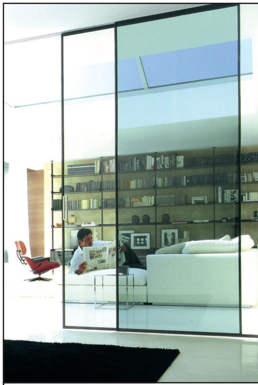
Pannelli "Velaria" Rimadesio, ideali per la casa moderna, come quella di Montezemolo

servizio di piatti che ancora oggi rappresenta un successo commerciale non indifferente. Poi venne chiamata da una firma famosa come Rosenthal per la quale creò oggetti di estrema novità e grande gusto, quindi da Bormioli Rocco, che quest'anno presenterà alcuni piatti della Fadda con una decorazione del tutto particolare. Iniziò i suoi primi lavori occupandosi soltanto di ceramica e vetro, ma ora sta volgendo la sua attenzione sempre più verso il metallo e plastica, per approdare presto anche al legno. «Sogno di potermi occupare anche di mobili, e, perché no, anche di moda e di tutti gli accessori che la circondano». Un nome che presto troverà un posto certamente anche nei cataloghi di grandi aziende, non solo italiane, per un modo diverso di concepire gli oggetti e per una interpretazione che esce dalle regole che sembrano diventate uguali per tutti.