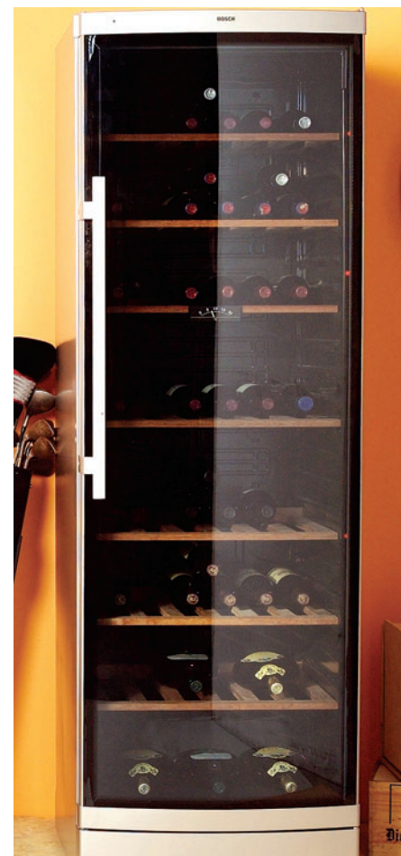
Il "WineCooler" è disponibile in due altezze, per contenere oltre cento bottiglie